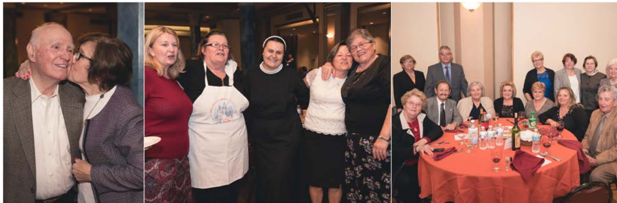
Godišnji župni banket – 22. listopada 2017.