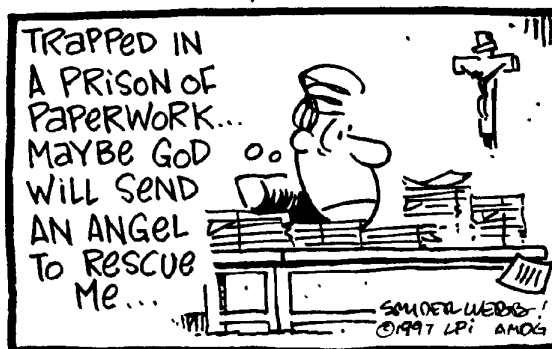
PETER AND PAUL, APOSTLES